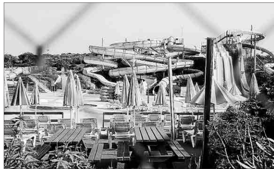
Cerrado desde el 17 de mayo de 2025. La propiedad del Splash desoyó la orden municipal de cierre y abrió del 1 al 16 de mayo, lo que ha motivado la sanción económica.

► Abonó 173.250 euros pocos días después del plazo voluntario, algo que la alcaldesa omitió